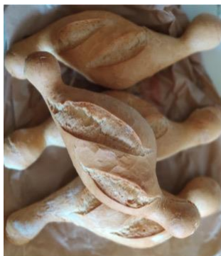
Figura 1 – Foto di una palatella